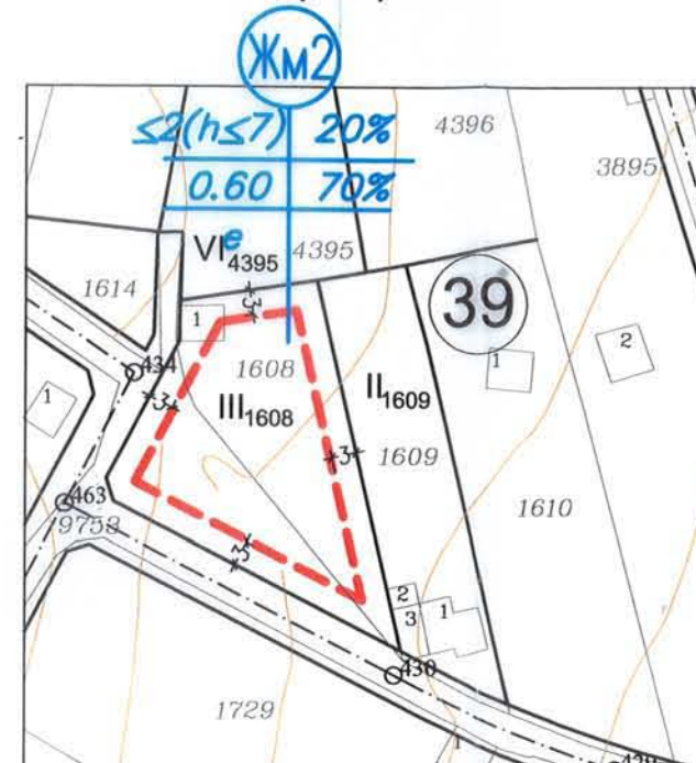
М 1 : 1000

за УПИ III 1608 , кв.39, с.о. "Боровец - юг" гр.Варна